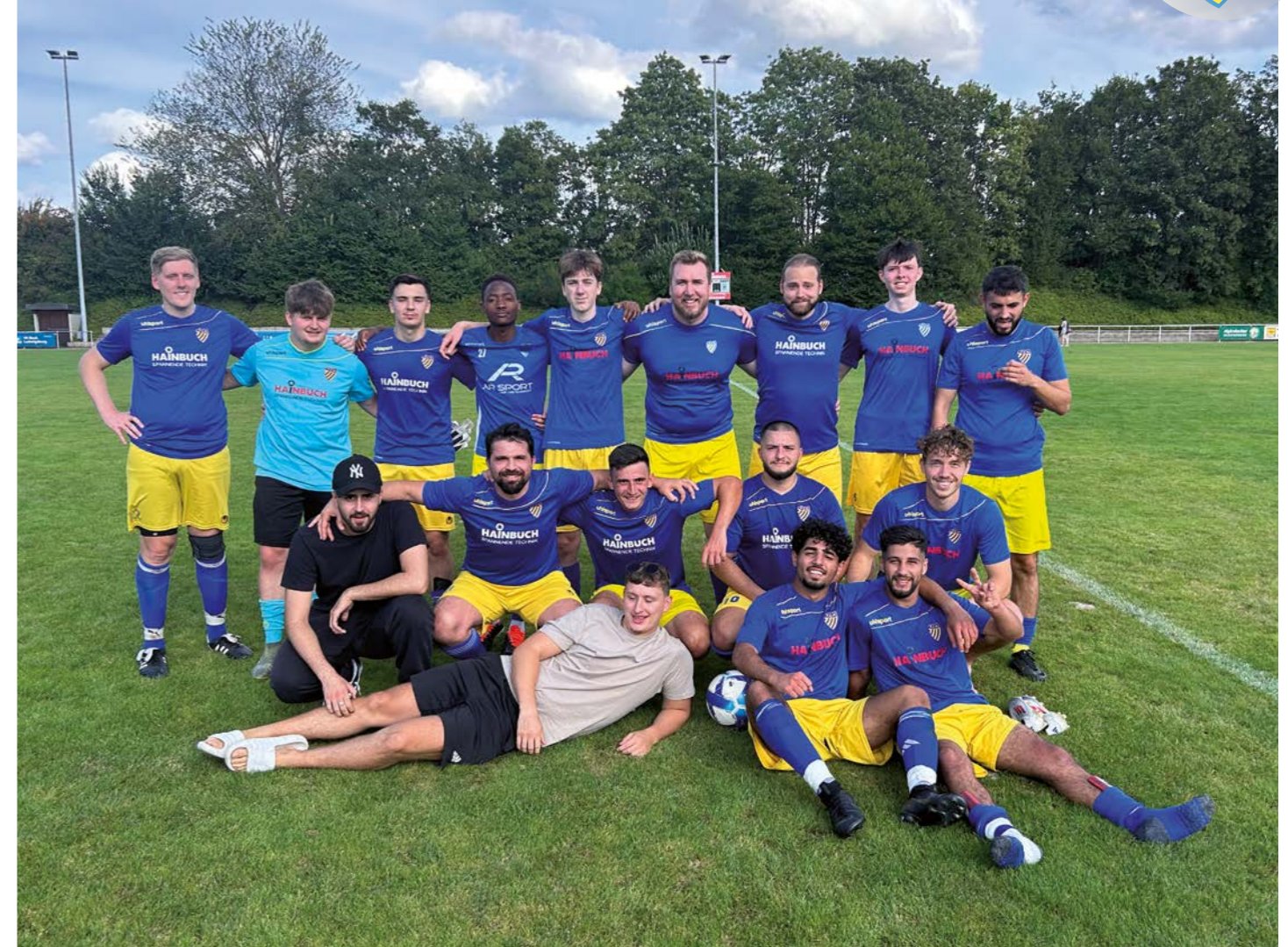
Unsere zweite Mannschaft nach ihrem 3:1 Sieg im Pokal gegen den GSV Pleidelsheim 3.