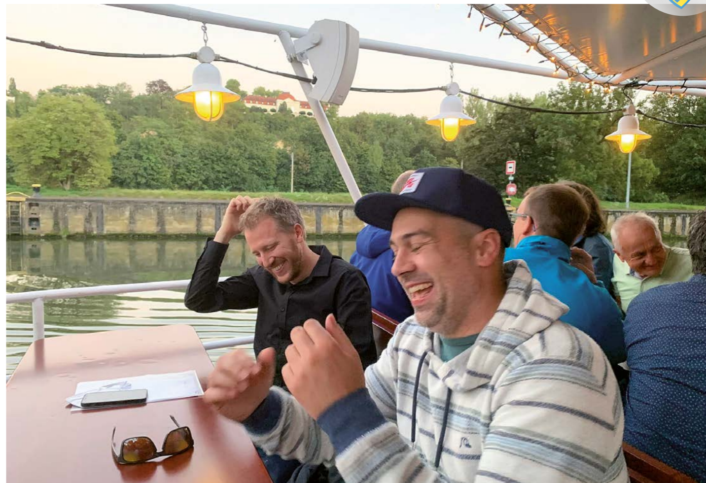
EINE SEEFAHRT, DIE IST LUSTIG, EINE SEEFAHRT, DIE IST SCHÖN...