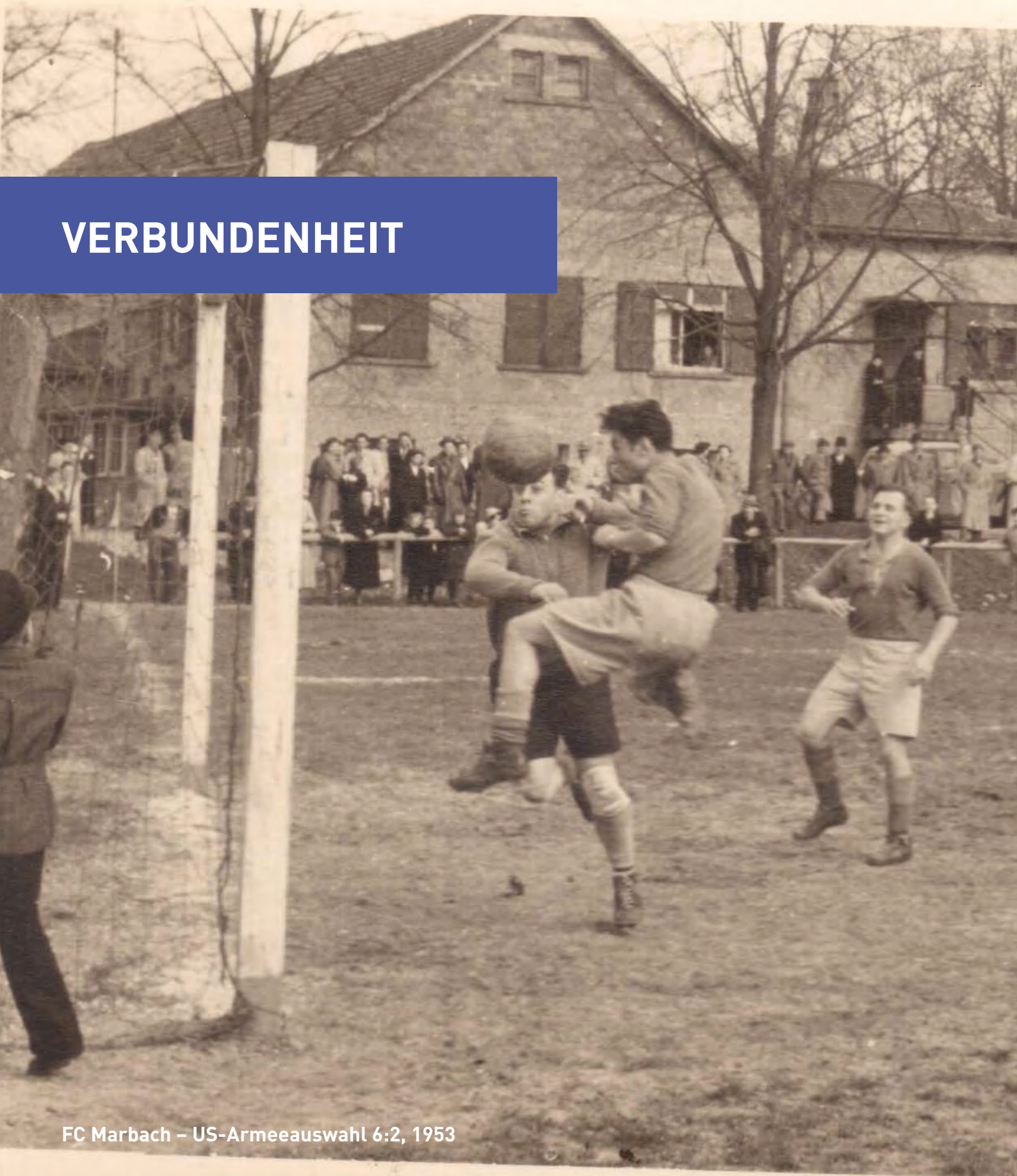
FC Marbach – US-Armeeauswahl 6:2, 1953