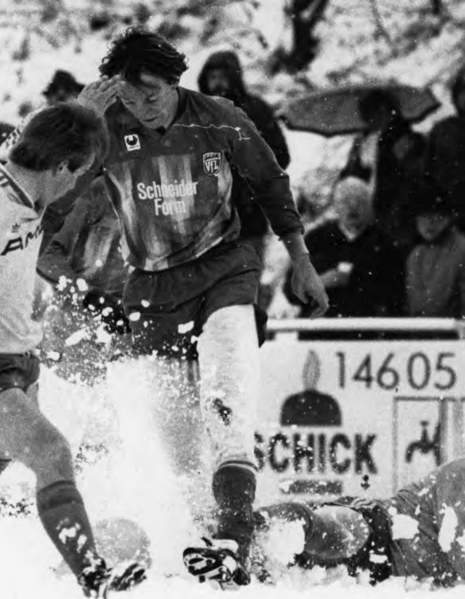
FC Marbach gegen VfL Kirchheim/Teck, Oberliga Baden-Württemberg Saison 1986/87